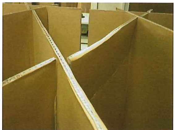
写真 2 (支持部の変形)